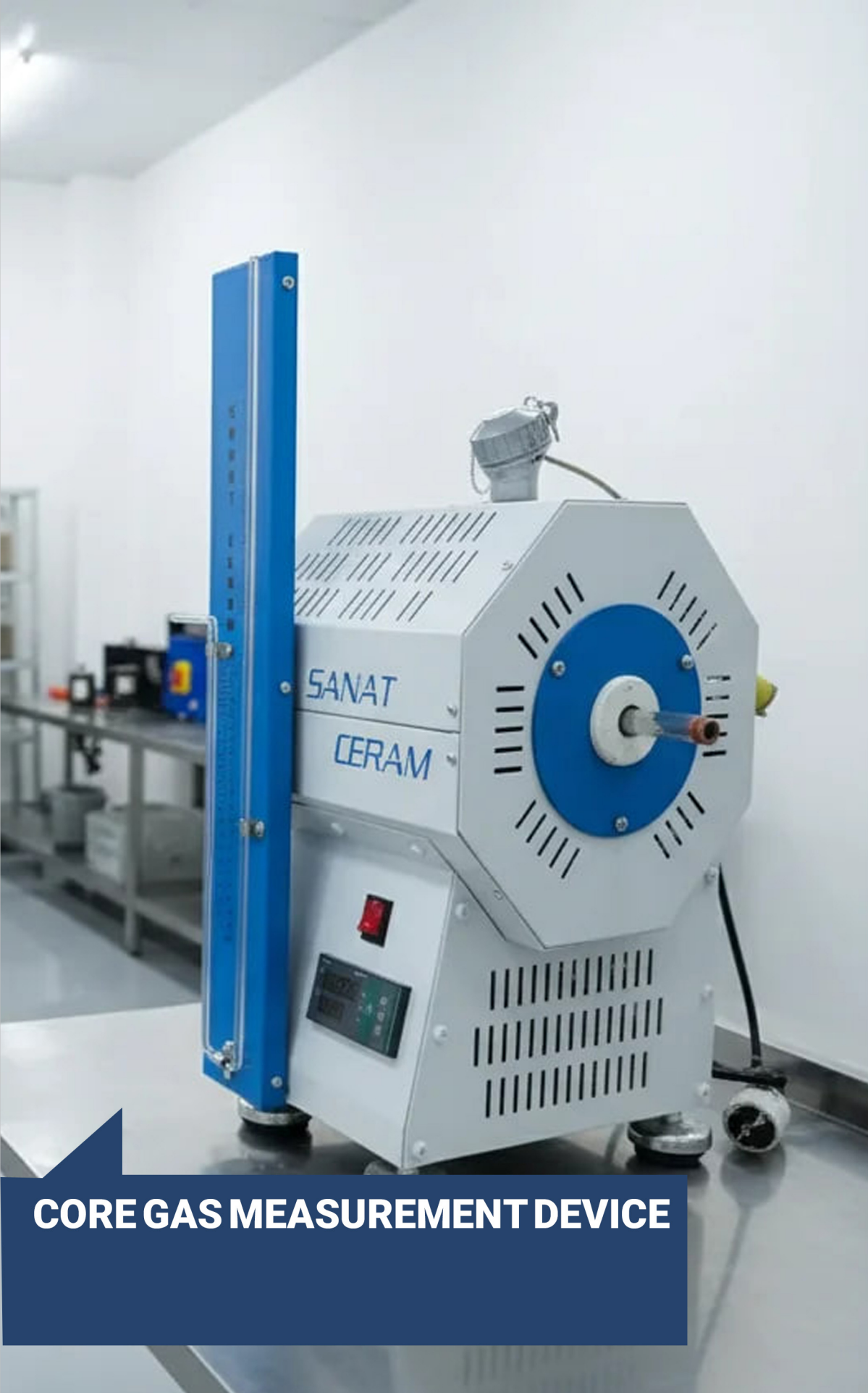
CORE GAS MEASUREMENT DEVICE